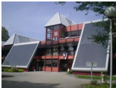
Le lycée de la Plaine de l'Ain